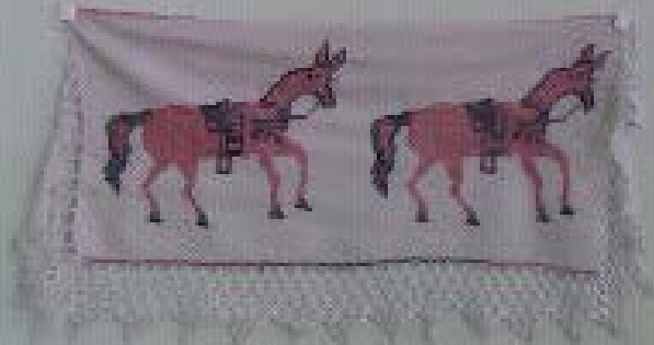
Embroidery on a light-colored fabric, featuring two horses in profile, facing right. The piece has a decorative, scalloped border at the bottom.