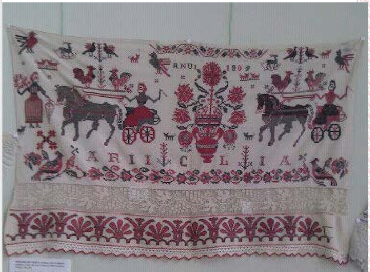
Embroidery on a light-colored fabric, featuring a central panel with a scene of two horses pulling a carriage, a woman in a red dress, and a central floral arrangement. The text "RNDI 1909" is visible at the top, and "ARLIC LIA" is visible at the bottom. The piece is surrounded by a wide, decorative border with repeating floral and geometric patterns in red and white.