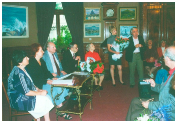
Вручение Диплома лауреата международной Дерибасовской премии, 2001 г.