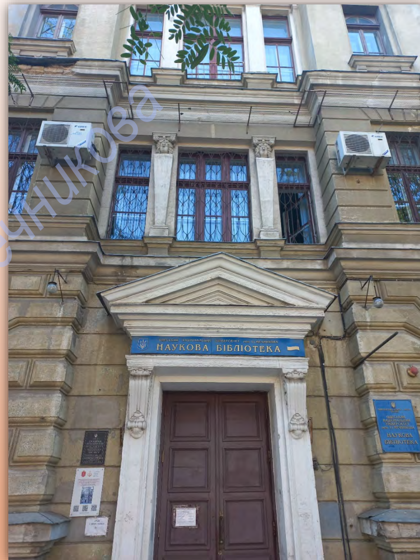
Сучасний вигляд будівлі Наукової бібліотеки ОНУ

Минуло понад сто років – століття змін, випробувань і нових епох. А втім, будівля Наукової бібліотеки Одеського національного університету імені І. І. Мечникова і досі стоїть у самому серці міста, як мовчазний свідок величі наукової думки та архітектурної майстерності. Попри численні ремонти, реконструкції й обставини, що диктували свій час, вона зберегла свою гідність і продовжує служити тим, хто шукає знання.