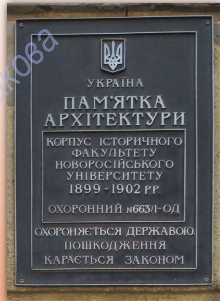
Охоронна табличка Наукова бібліотека ОНУ (вул. Преображенська, 24)

Будівля, в якій з 1902 р. розташовується Наукова бібліотека ОНУ імені І. І. Мечникова , – не просто архітектурна окраса Одеси. Це пам'ятка архітектури (№ 663/1 – Од) і пам'ятник історії, офіційно внесений до реєстру об'єктів культурної спадщини (наказ Міністерства культури і туризму від 20.06.2008). За її стінами – понад півтора століття історії, пов'язаної з наукою, просвітництвом і культурним розвитком Півдня України. Тут зберігаються унікальні фонди, творилася наука і народжувалися покоління інтелігенції, що формували обличчя української культури.