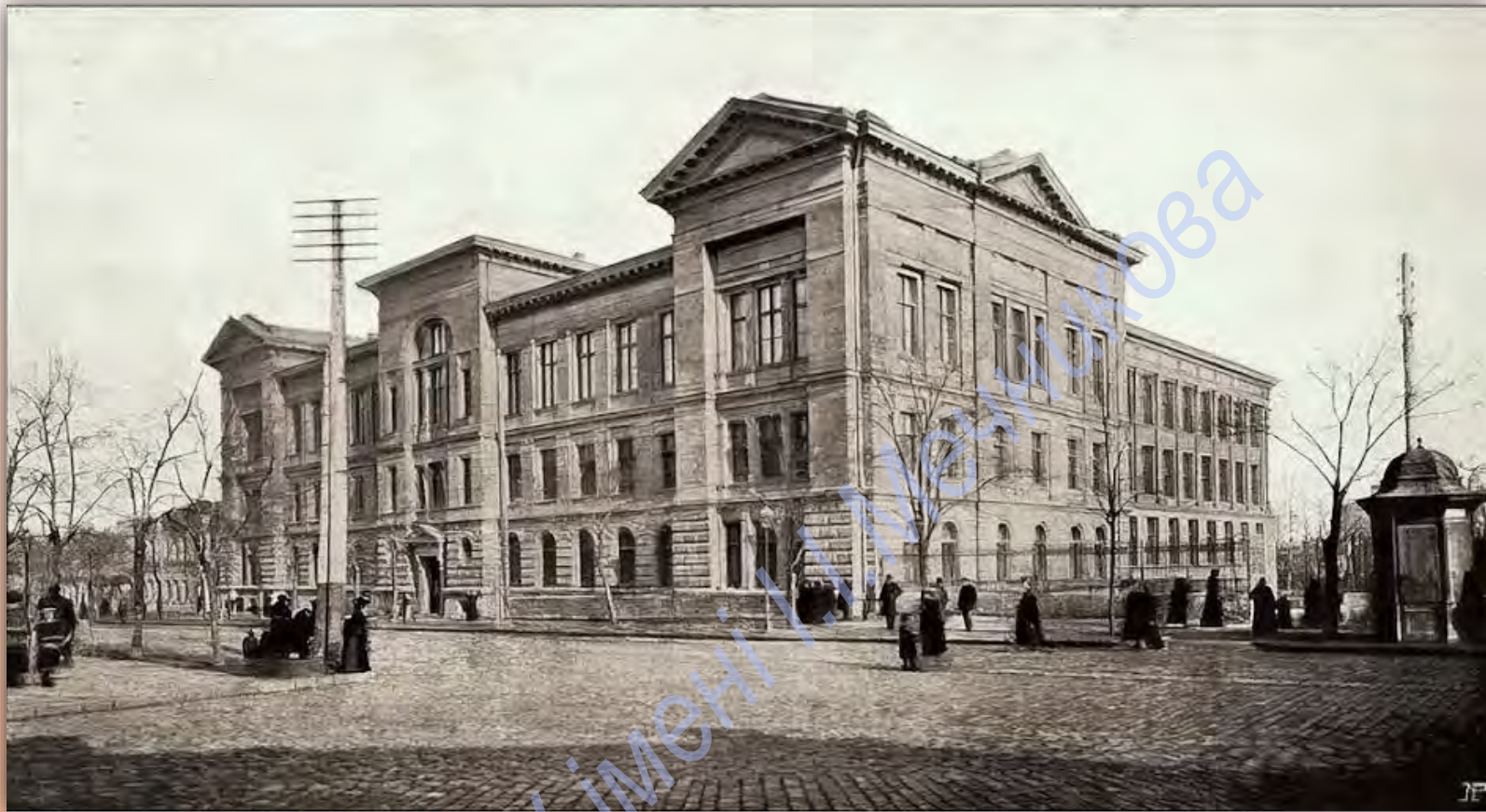
Будівля Наукової бібліотеки ОНУ імені І. І. Мечникова у 1910-ті рр. (Преображенська, 24)