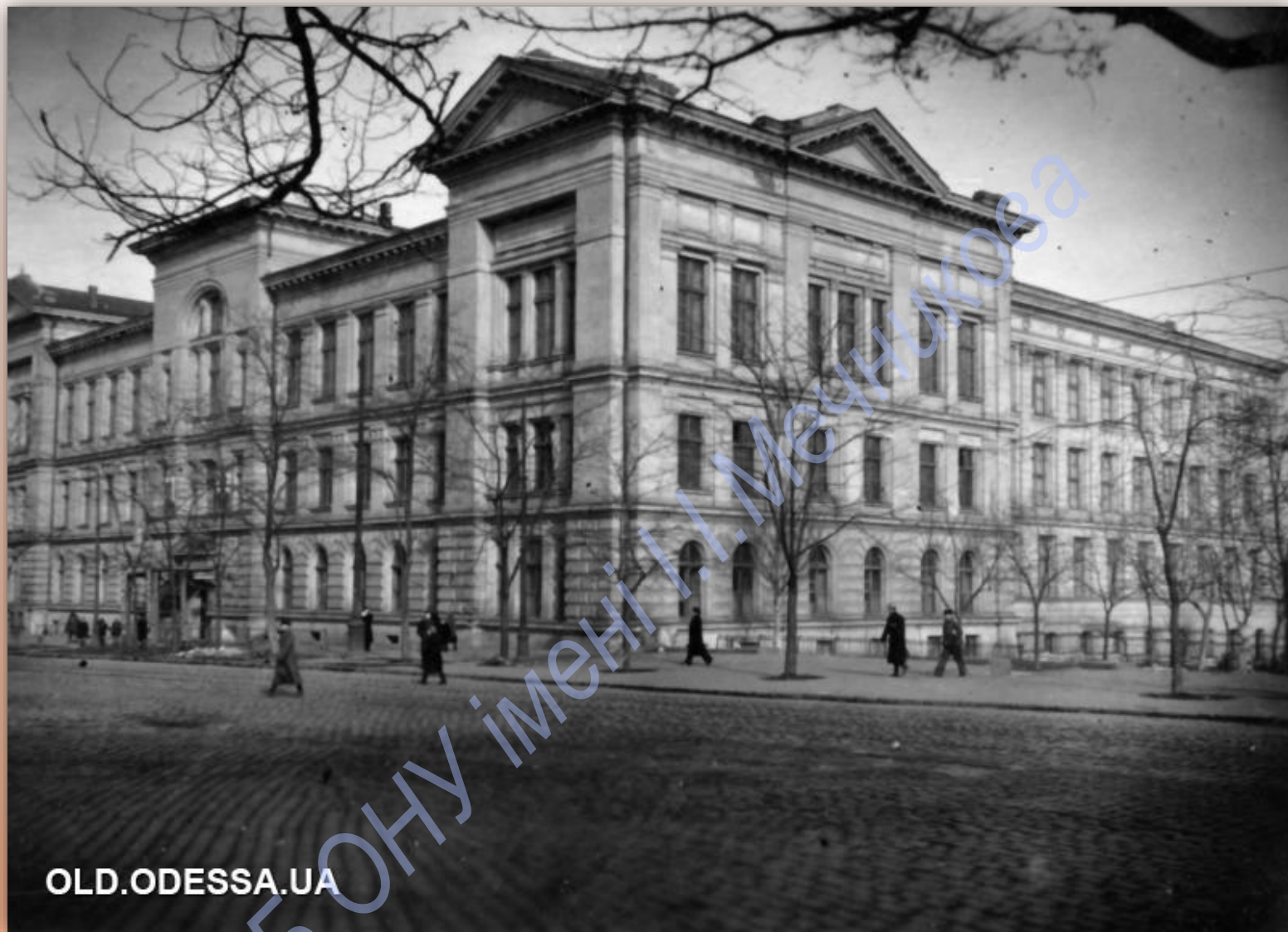
Будівля Наукової бібліотеки ОНУ імені І. І. Мечникова в 1950-ті рр.