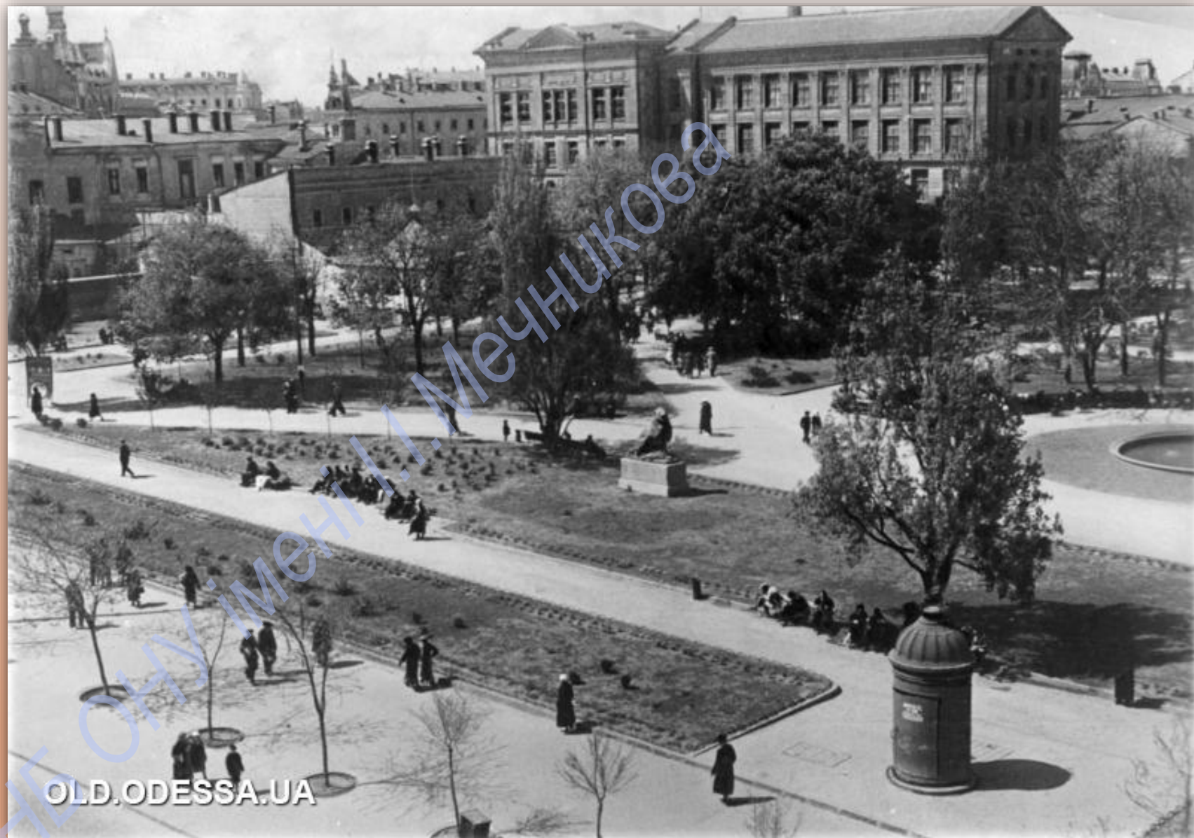
Поштова картка

Міський сад. Вид на бокову частину і задній фасад будівлі Наукової бібліотеки ОНУ приблизно в 1927-1938 рр.