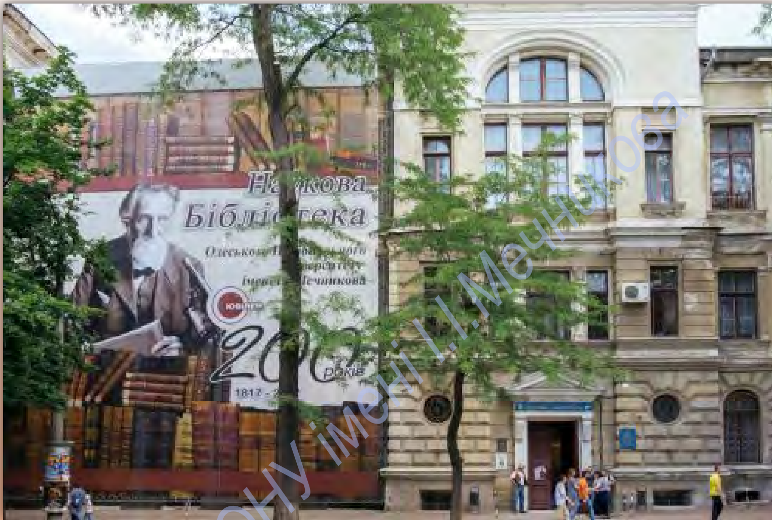
Будівля Наукової бібліотеки ОНУ імені І. І. Мечникова в 2017 р. (До 200-річчя Наукової бібліотеки)