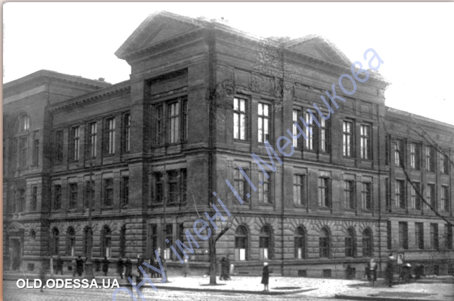
Будівля Наукової бібліотеки ОНУ імені І. І. Мечникова у 1926 р.