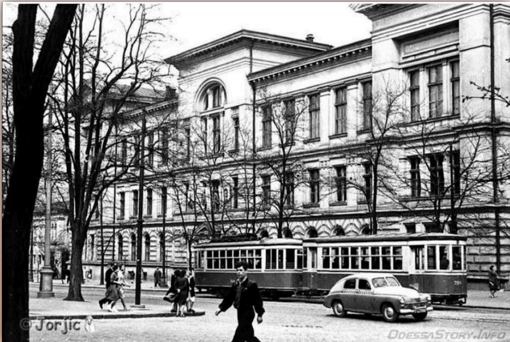
Будівля Наукової бібліотеки ОНУ імені І. І. Мечникова, 1954 р.