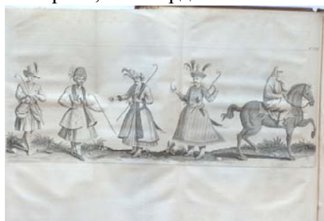
Ілюстрація з подорожей Ж. Б. Таверньє

У колекції представлено перше видання двохтомного збірника географічно-етнографічних описів різних країн і народів М. Тевено «Реляції про різні цікаві подорожі, які не були опубліковані» (Париж, 1663-1672). Саме тут за кілька місяців до виходу у світ всієї книжки було опубліковано перший нарис книжки П. Шевальє «Реляція про козаків із життєписом Хмельницького, здобутим з рукопису». У фондах зберігається також перше видання славетного твору П. Шевальє (Париж, 1663).