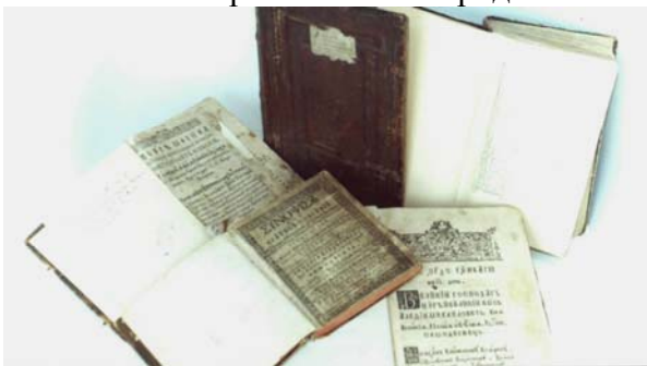
Видання друкарні Києво-Печерської Лаври

Цінними є і ті Лаврські видання, які виходили у XVIII ст. Це «Універсал» гетьмана Івана Скоропадського, проголошений у Лебедині «декембрия 8, року 1708»; і видання «Новый завет. Деяния апостолов. Послания апостолов. Апокалипсис», датоване 1741 р. Розкішне, з багатьма гравюрами видання «Тріодь цветная» – 1747 р.; перше видання книжки Димитрія митрополита Ростовського (Дмитра Туптала) «Розыск о раскольнической брынской вере, о учении их, о делах их» (1748). Є також видання львівські, почаївські, як от: «М. Даннемар. Наставления истории церковныя Нового Завета» (Львів, 1790); «Книга отца нашего Никона, игумена Чорныя горы» (Почаїв, 1795). Західноєвропейські видання XVII–XVIII вв. у фондах Наукової бібліотеки представлена прижиттєвими виданнями видатних європейських філософів, вчених, письменників, мандрівників того часу, зокрема виданнями політичних та історичних трактатів Гуго Гроція, Томаса Гоббса і Джона Мільтона, праць великого чеського