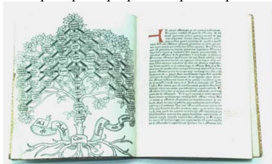
Трактат Андреа Йохана «Про дерева кровного споріднення, близькості, а також про спорідненість духовну» (Нюрнберг, не пізніше 1476 р.)

Колекція видань XV ст. Найстаріша книжка, яка зберігається у фондах бібліотеки Одеського національного університету – трактат відомого юриста, знавця канонічного і цивільного права Йоганна Андреа “Про дерева кровного споріднення, близькості, а також про спорідненість духовну” (“ Super arboribus consanguinitatis, affinitatis et cognationis spiritualis ”), виданий в Нюрнберзі Фрідріхом Крейснером не пізніше 1476 р.