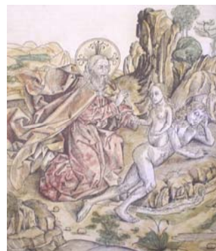
Гравюри з «Всесвітньої хроніки» Г. Шеделя

Колекція видань XVI ст. , які зберігаються у фондах бібліотеки, нараховує біля 500 книжок латинською, французькою, німецькою, італійською, чеською, польською, грецькою, англійською, іспанською мовами, в тому числі 92 палеотипа (видань I половини XVI століття).