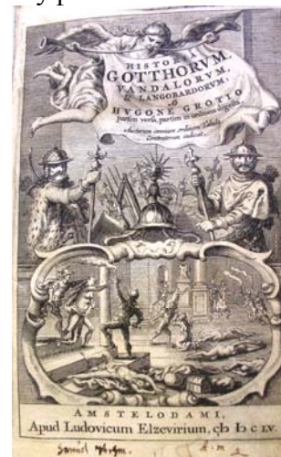
З університетської Ельзевіриади

Наукова бібліотека має прекрасне зібрання описів подорожей, виданих у XVII–XVIII ст. Це описи географічних експедицій у всі частини світу, а також мандрівок по Україні і Росії. Серед описів подорожей на Схід, які здійснили європейці у XVII – XVIII ст., – твори Ж. Б. Таверньє, І. А. фон Мандельсло, Ф. Берньє, Ж. Шардена.