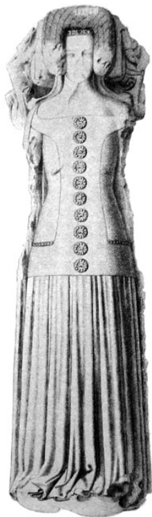
Рис. 2. Ефігія леді Джоан де Моун з крипти Кентерберійського собору

досі можна побачити її ефігію, напис на якій свідчить: «Por dreu priez por larme Johane de Borwaschske feut dame de Mohun» 22 (див. рис. 2).