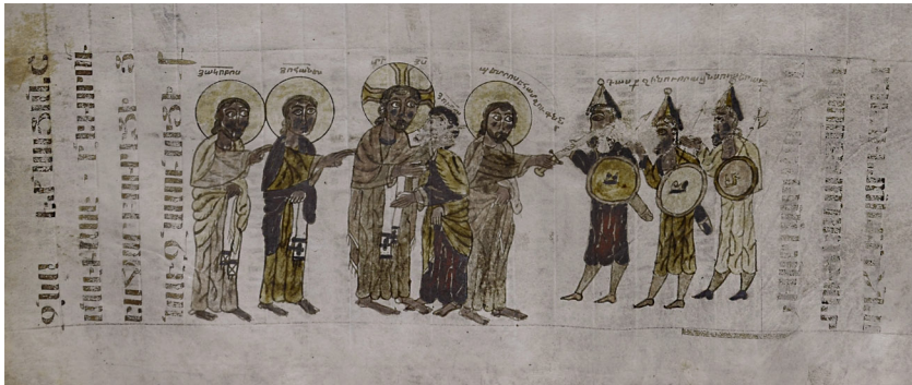
Додаток 3. Мініатюра “Поцілунок Юди”, кінець X – початок XI ст. Вегапарське Євангеліє. Кінець X – початок XI ст. Матенадаран. Мс. 10780, ф. 71r. Фото люб’язно надане Інститутом стародавніх рукописів імені Месропа Маштоца (Матенадаран).

Взято з: Արրահանյան Վ. Միջնադարյան Հայաստանի... նկ. 4.