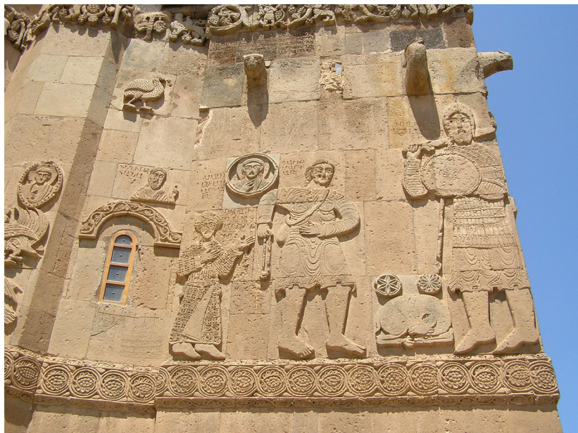
Додаток 4. Рельєф “Давид і Голіаф”, 915–921. Церква св. Хреста на о. Ахтамар (озеро Ван, Туреччина).