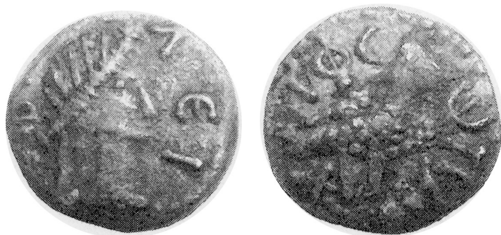
Fig. 2. Slatina, Brno; Sarmatia, Olbia, c. mid-1st century AD, AE.

Regardless of this, in the light of the currently available knowledge, the circumstances of the influx of the two Olbian coins described are different and it is difficult to discuss the phenomenon of the influx of such coins to the area of the Central European Barbaricum as a whole. The differences stem from the varying cultural background and context of the influx of both coins. Due to the relatively modest material available, the proposed concepts regarding the direction and time of their arrival should be treated as working hypotheses. Their confirmation or negation may be brought by further and more extensive research, as well as possible new discoveries. In an era seeing the widespread use of metal detectors, such new discoveries are more than to be expected. 36