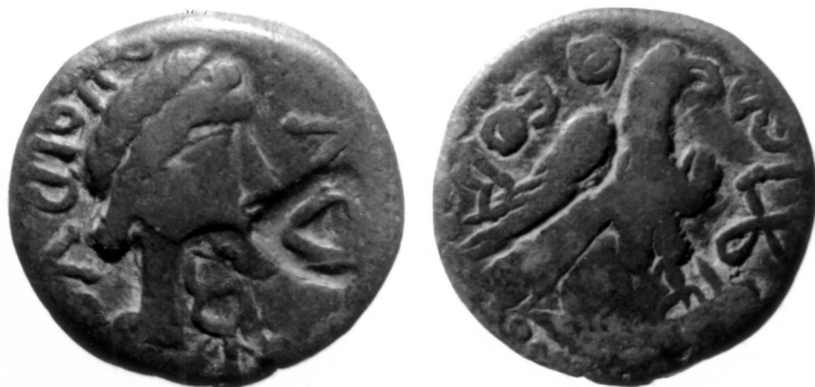
Fig. 1. Glinik Mariampolski, Gorlice; Sarmatia, Olbia, c. mid-1st century AD, AE.