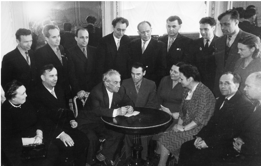
Зустріч студентів і викладачів з Максимом Рильським на одеських теренах.