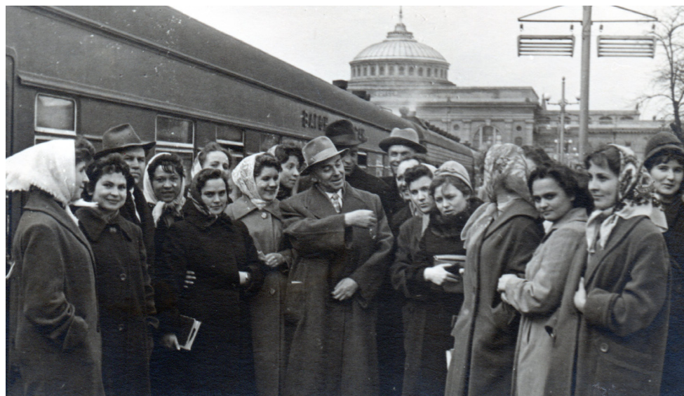
Зустрічаємо Павла Тичину на Одеському залізничному вокзалі.